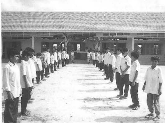
新校舎に生徒が花道を作り贈呈式

が不足していて何とか学校建設資金の援助を受けられないかとの、日本の救援組織である「幼い難民を助ける会（略称CY.R）」の要請を受けクラブ員一同の総意により、カンボジア王国カンダールフタン郡バンキア村のバンキアン小学校々庭に5教室を計画し、3年間計画でチャリティーゴルフの益金や街頭募金等メンバーの汗の努力と賛同して寄付してくれた多くの日本人の真心の資金により昨年12月3日地元関係者の見守る中、(当クラブの子クラブである千葉グリーンLCの有志と) 起工式に出席し右記のCY.Rの現地駐在員に建築業者の選定及び父兄関係者による建設運営委員会をつくってもらい事後を託して来たが、逐一写真付きの進捗状況の報告を受けていたが当初、政情不安定なカンボジアなどに学校などが建つものか疑心暗鬼であったが4月29日の落成式に招か