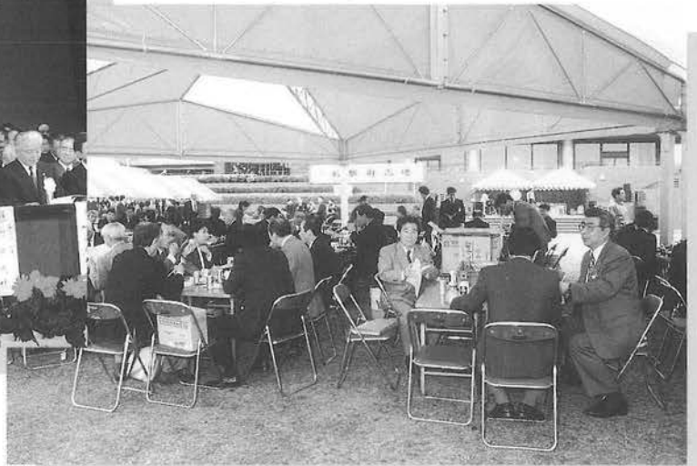
大会会場の広場で食事