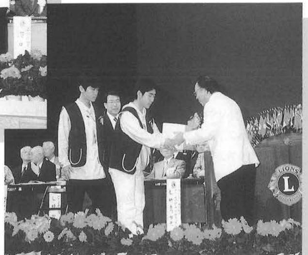
レオクラブ代表から使用済切手をガバナーへ