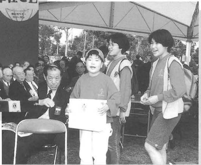
レオクラブ大会会場にて、阪神大震災募金活動