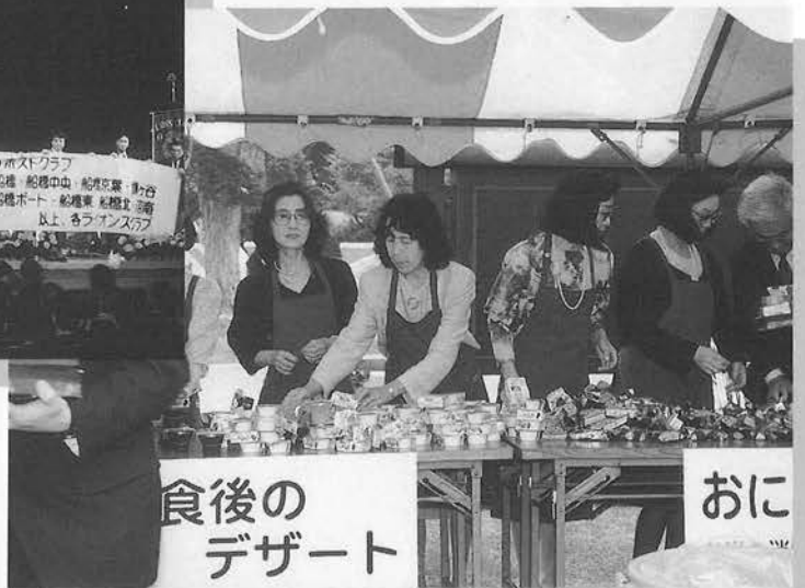
ライオンレディもご苦労様