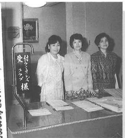
受付でキャビネット事務局の皆さん