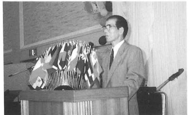
L 中台会長 開会のゴング

第1回と銘打ってあるので今後このクラブの継続事業として多彩な活動のメイン事業としての位置付けがわかる。新進気鋭のクラブの活動は実にすっきりしている。関係者各位に盛大なエールを贈りたい。