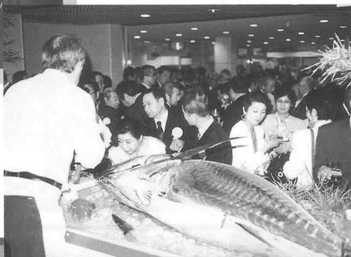
豪快なマグロの一刀切り