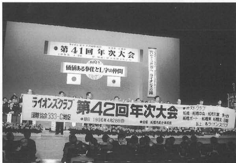
次期の第42回年次大会は、 1996年4月28日(日)船橋市総合体育館にて