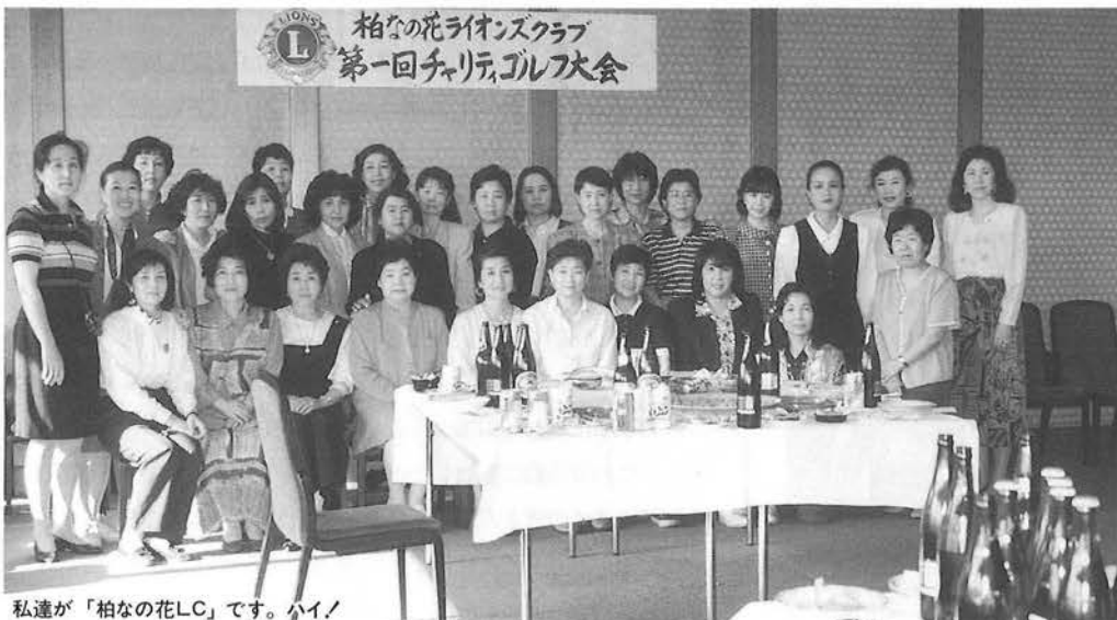
私達が「柏なの花LC」です。ハイ!

理論と実践がままたまなかった多くの参加者から義援金がよせられ、うち500,000円がキャビネットを通して現地に送られた。