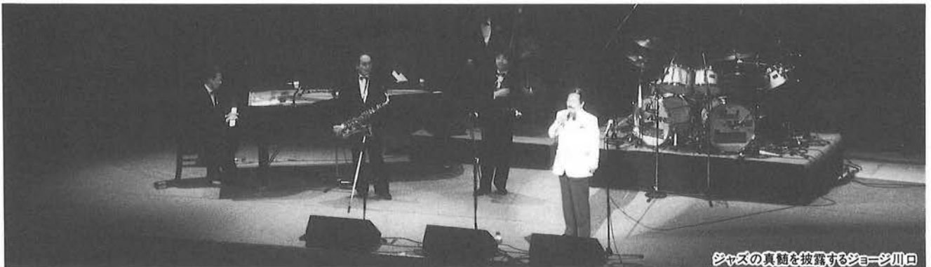
ジャズの真髄を披露するジョージ川口

ビッグな企画とあってチケットの売り上げも好結果で、金銭アクティビティは4,200,000円となった。内訳は柏市へ車椅子30台(3,000,000円)柏市福祉公杜にヘルパー移動用軽自動車1台(900,000円)そして阪神大震災の義援金300,000円となっている。