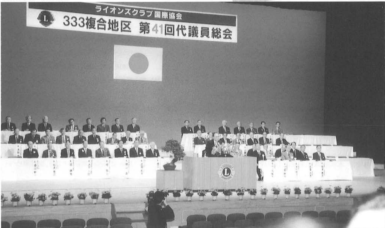
複合地区大会 代議員総会