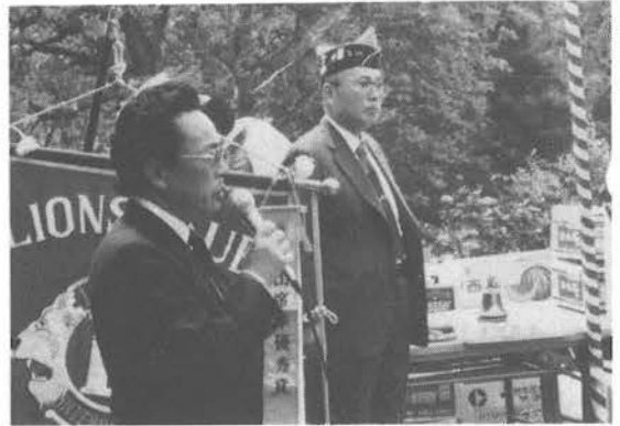
▲青空例会で挨拶するL秋場ガバナーとL鹿野会長。

今年は小生記録係であったが、接待役が足りなくて、お相手に忙がしい一日を送ったのであった。