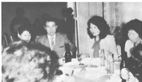
LS 佐々 幼子記

議題をおえて、中食会に移りました。その間に交わされた話題は、フォーマルな会での収穫と一味違った、ライオネスクラブならではのものでした。