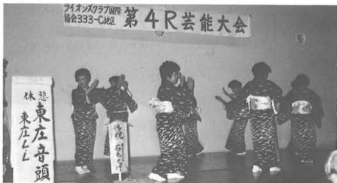
母(LL)が歌を娘が踊りを▶ 満場を沸したゴールデン賞

◀お母さん方(LL)ありがとう 今回も忙しい間を見て練習した事でしょう。 この輪こそ第4Rの輪になるのです。