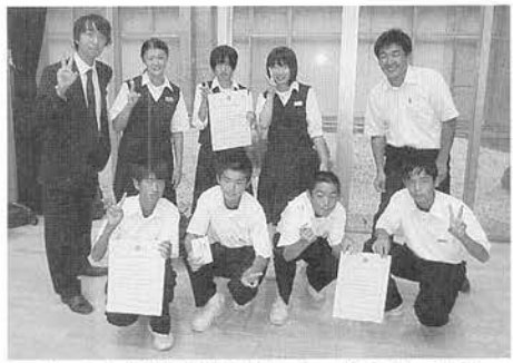
旭市中学校英語発表会で優秀な成績を修める