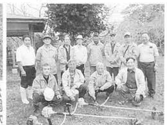
作業を終わって一同パチリ