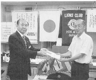
会長から体育祭用ノートを教頭へ