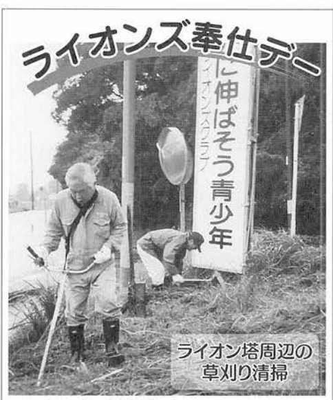
ライオン塔周辺の 草刈り清掃

■とき 10月3日 ■ところ ライオン塔周辺 干潟ライオンズクラブでは、ライオンズ奉仕デーに、地区内3ヶ所のライオン塔周辺の草刈り清掃を行った。