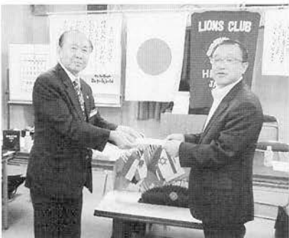
会長から弁論大会助成金を校長へ贈呈