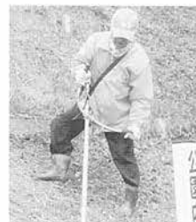
急な傾斜の草刈り