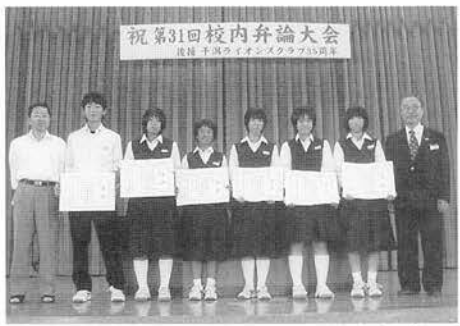
干潟中弁論大会10万円・体育祭賞品ノート300冊支援