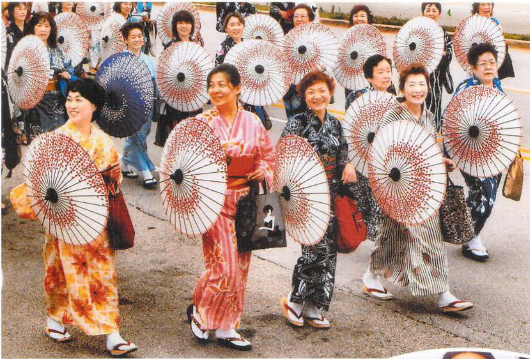
シカゴ国際大会 「パレード参加の 大和撫子」