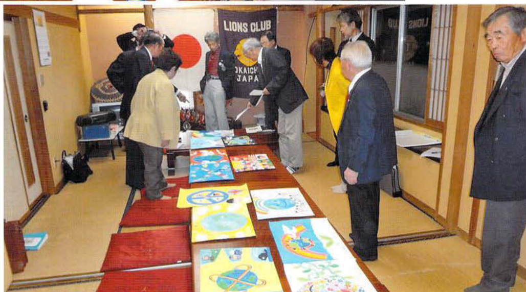
国際平和ポスター・ コンクール作品の 選考風景