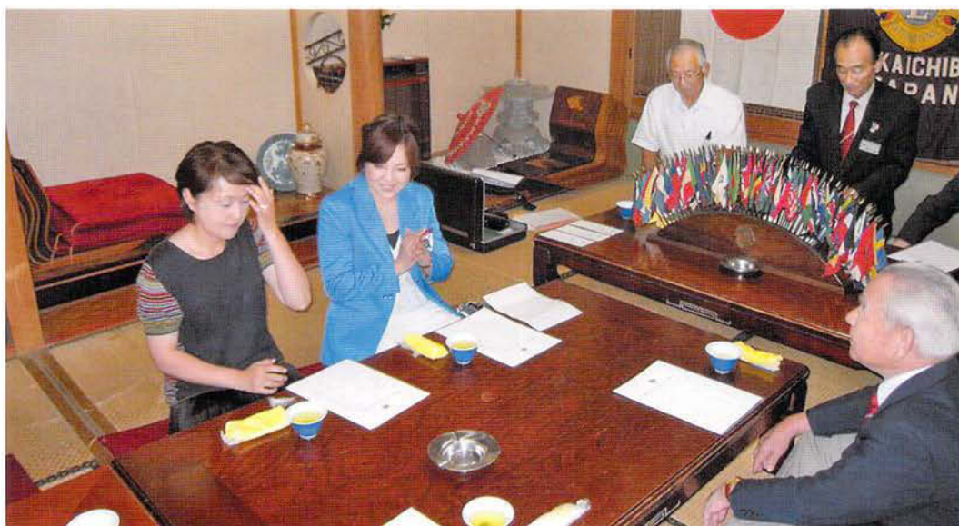
YCE生の 壮行会の風景