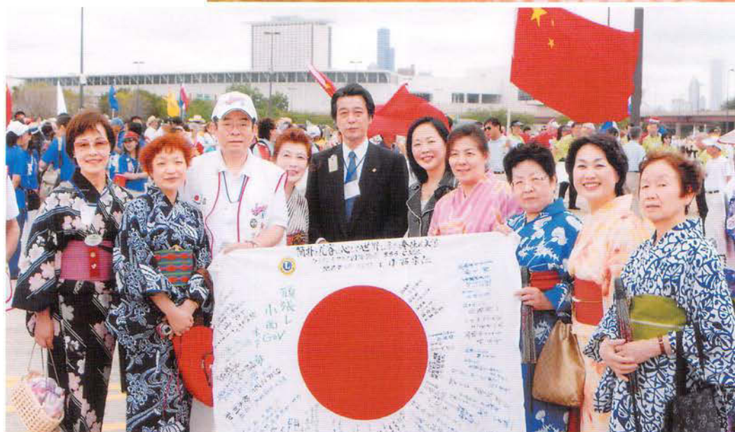
シカゴ国際大会 「L後藤・L小西と 大和撫子」