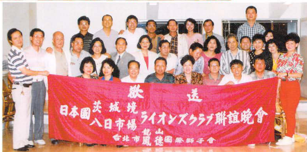
国際交流 「台北市龍山L C・ 鳳徳L Cでの歓迎会・ 茨城境L Cと共に」