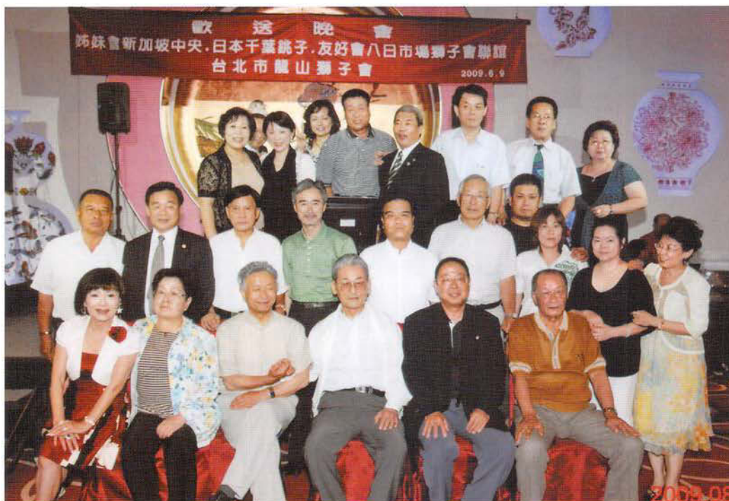
国際交流 「台北市龍山L Cの 40周年での歓迎会・ 銚子L Cと共に」