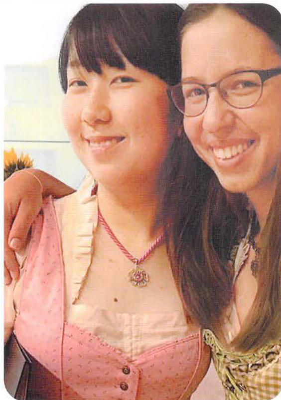
キャンプ最後日 別れが寂しい