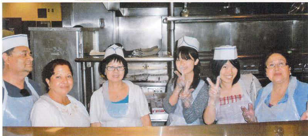
ホストファミリーと 一緒に失業者への 炊き出しの手伝い