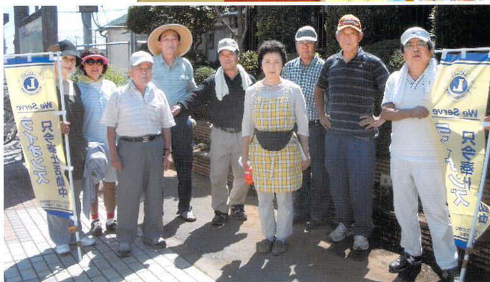
八日市場駅前花壇の 整備・清掃風景