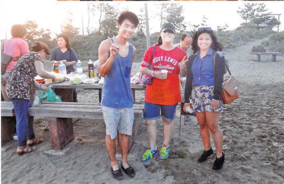
国際交流 「匠瑳市国際交流協会の 近隣外国人の交流会にて」