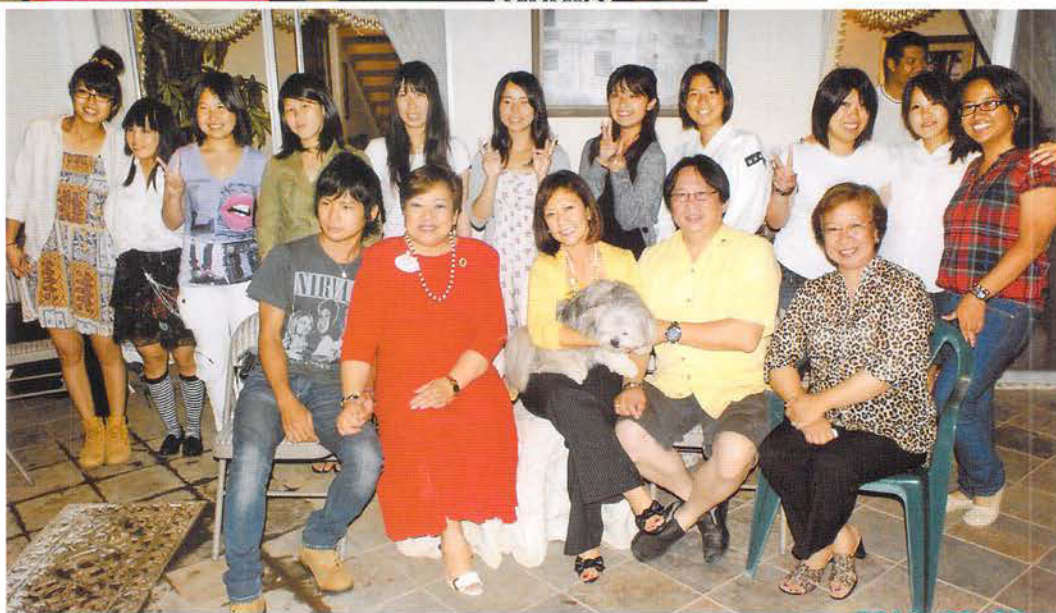
ホストファミリー でのウェルカム パーティー