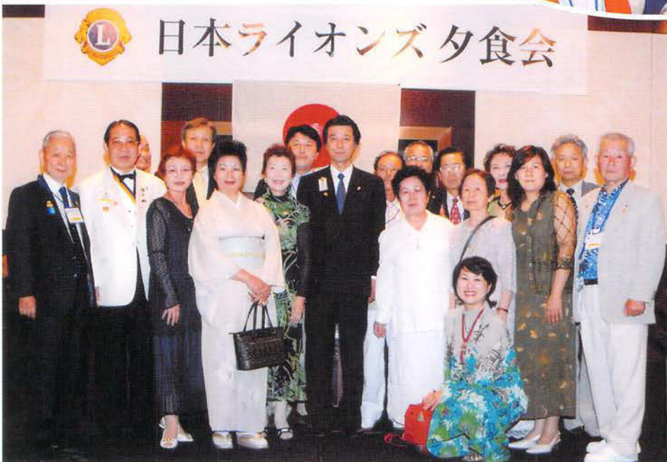
デトロイト国際大会 「日本ライオンズ 333-C地区の夕食会」