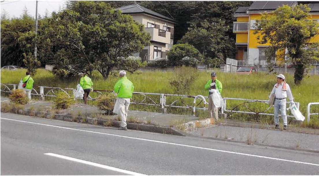
ゴミゼロの 清掃作業風景