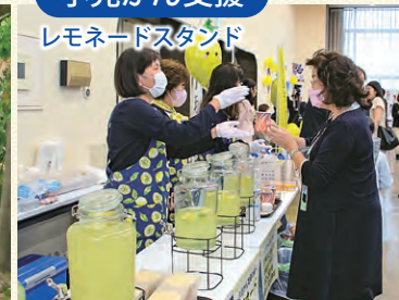
レモネードスタンド