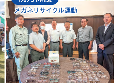
メガネリサイクル運動