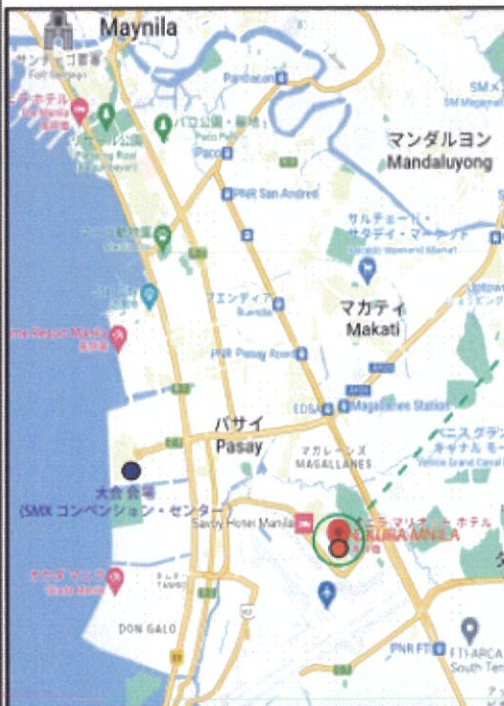
※大会会場から夕食会場まで、車で片道約30分

マリオット ホテル メイン ウィング マニラ ホールルーム Marriott Manila / Main Wing 1階 "Manila Ballroom A"