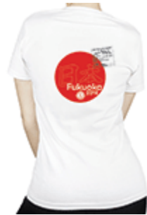
品番：CSW-16 レディースTシャツ S~XL コットン100% US$19.45

福岡大会ピン・タブ・バナーは大会現地の公式用品ストアでお買い求め可能です。詳しくは現地スタッフにお問い合わせください。