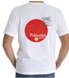
品番：CSM-16 メンズTシャツ S~XL コットン100% US$19.45