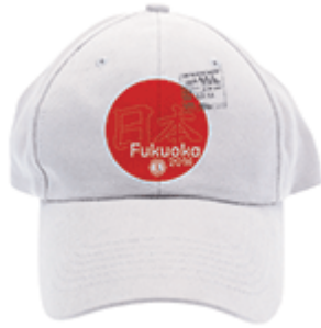
品番：CC-16 福岡大会キャップ コットン100% フリーサイズ US$19.45

Tシャツの日本人向けのサイズS~XLは、数に限りがございますので上記期日までにご注文いただければ、大会出発前にお届け可能です。お届けは6月中旬を予定しております。